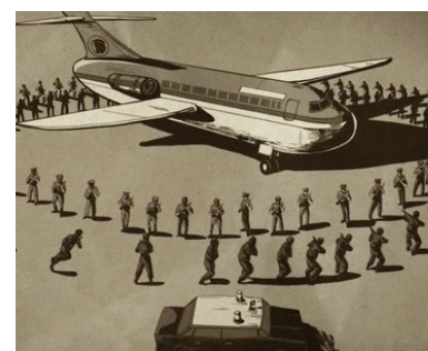
"Crisi di Sigonella 1985 (disegno)"

sembrerebbe che Giorgia Meloni stia cercando di inserirsi nel solco di questa pur breve tradizione, con l'obiettivo di dimostrarsi un alleato fedele ma non subordinato agli Stati Uniti. Bisogna però tenere conto di due differenze fondamentali rispetto al passato: innanzitutto, gli Usa non rivestono più quel ruolo di assoluta centralità nel panorama internazionale e Trump è decisamente un leader molto più imprevedibile di quanto non lo fossero i suoi predecessori.