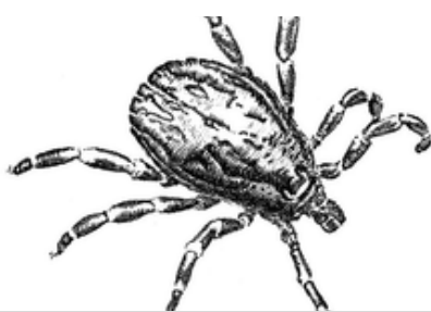
"Ixodida o zecca" (disegno)

Nessuno lo direbbe mai, eppure l'Ixodida, comunemente chiamata zecca, rientra nella famiglia degli Aracnidi ed a lei è dedicato uno dei racconti più significativi nel libro "L'anello di Re Salomone" di Konrad Lorenz. L'etologo viennese, vincitore del premio Nobel per la Medicina nel 1973, nella sua raccolta di racconti, utilizza l'arco esistenziale della zecca come archetipo d'un'esistenza diametralmente opposta alla