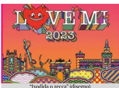
“Ixxodida o zecca” (disegno)

Il Love Mi, festival musicale di beneficenza ideato da Fedez in collaborazione con J-Ax, ha subito colpito l'attenzione del pubblico meneghino e non solo. La prima edizione, svoltasi il 28 giugno 2022, è stata capace di lasciare immediatamente il segno, con migliaia di persone accorse per ascoltare i numerosi artisti italiani sul palco. L'enorme successo ha poi portato alla seconda edizione,