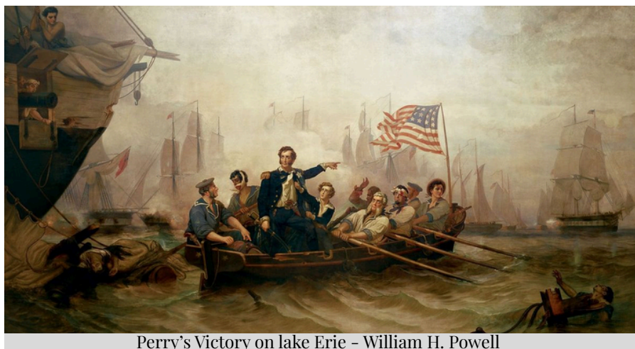
Perry's Victory on lake Erie - William H. Powell

Inoltre un rifiuto europeo, già riscontrabile nelle azioni di stati come l'Italia e la Spagna, porterebbe ad una situazione di "quasi guerra" come quella del 1793 tra gli alleati? D'altronde, al giorno d'oggi gli strumenti a disposizione degli stati per combattere non sono esclusivamente militari, ma possono anche essere economici come i dazi. Io non posso sapere come evolverà la situazione, ma l'Europa deve resistere e difendere le sue prerogative come Alexander Hamilton esortò il presidente Washington a fare nel lontano 1793.